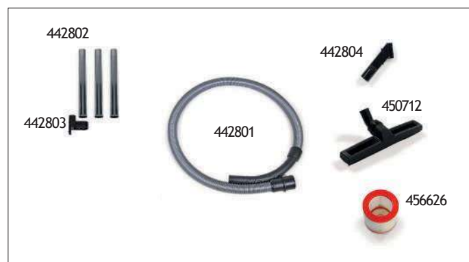
KIT D'ACCESSOIRES Ø32 (EN SÉRIE)